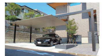
カーポートSC 2台用梁延長タイプ フェンスAB デザイナーズレール エクステリアライト美彩

カースペース、アプローチをまたぐよ うに配置されたゲートはファサードに一 体感を生み出します。