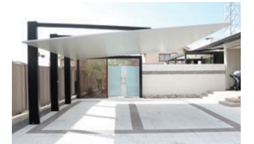
カーポートSC後方支持2台用

後方支持タイプを取り入れたことで圧 迫感が抑えられ、オープンスタイルの外 構にマッチ。