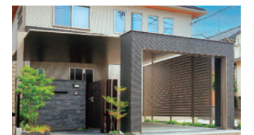
カーポートSC 2台用 シングルシャッターS デザイナーズパーツ 開き門扉AA アーキレール

木調色の天井面に木目が施されたG ウォール ラッピングボードをコーディ ネート。