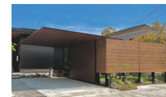
カーポートSC プラスG(Gウォール)

カースペース、アプローチをまたぐよ うに配置されたゲートはファサードに一 体感を生み出します。