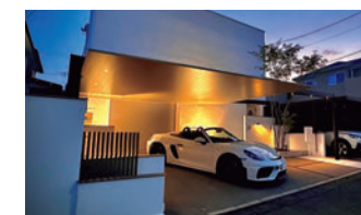
カーポートSC 2台用梁延長タイプ ダウンライト

90度回転納まりにすることで、住宅との一体感を叶え、使いやすいカースペースを実現しています。さらに天井に取り付けたシームレスラインライト、ダウンライトが夜の顔を引き立てています。