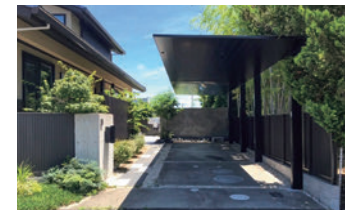
カーポートSC縦2連棟

オールブラック色にすることで、スタイ リッシュで洗練された外観をつくり上 げています。