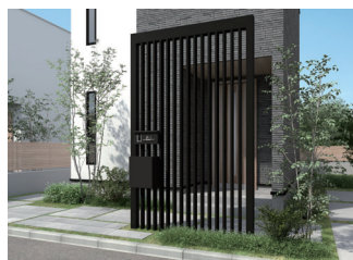
パネルファンクション

プラスGに門まわりに機能をすっきりと集約できるパネルファンクションとアーチファンクションが登場。住まいの美しさを引き立てながら、使いやすい門まわりをつくれます。