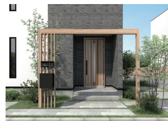
アーチファンクション

●表示価格は2022年10月現在のメーカー小売希望価格です。商品ごとの価格で、取付費・工事費等は別途となります。●商品価格は全て税別価格です。●仕様、価格は予告なく変更する場合があります。