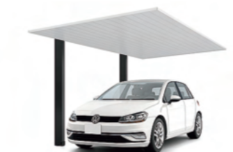
カーポートSC 1台用 基準風速 VO=40 m/s