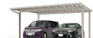
ソルディーポート 2台用 基準風速 VO=44 m/s