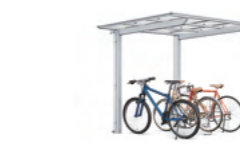
フーゴF ミニ 基準風速 VO=38 m/s