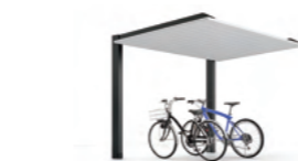
カーポートSC ミニ 基準風速 VO=40 m/s