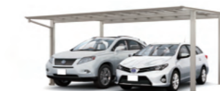
フーゴF 2台用 基準風速 VO=40 m/s