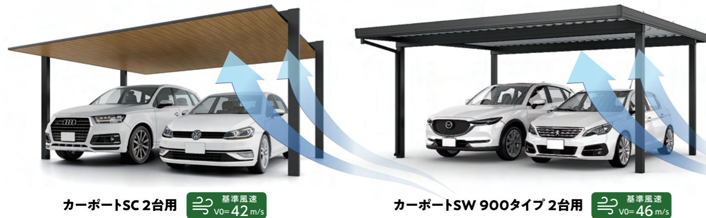
カーポートSC 2台用 基準風速 VO=42 m/s