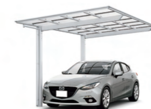
フーゴF 1台用 基準風速 VO=38 m/s