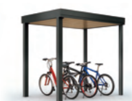
Gルフサイクルポートタイプ 基準風速 VO=38 m/s