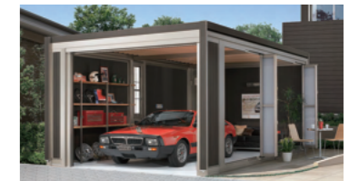
スタイルコートL 基準風速 VO=34 m/s