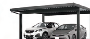
カーポートST 2台用 基準風速 VO=46 m/s