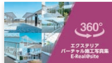
建築外構・土木で必要とされるエクステリア製品をバーチャル映像でご紹介E-Real@site