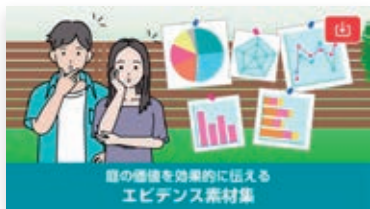
営業・商談シーンに!庭の価値を科学的に紐解いたツールをご提供