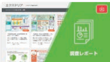
商談に役立つ業界知識!調査レポートのご紹介【会員限定】