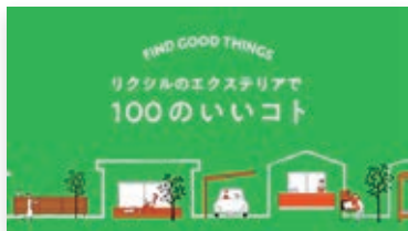
販促活動にもお役立ち!エクステリアの魅力や価値を発信中!