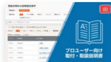
取り扱い説明書一覧