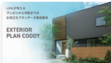
LIXILが考えるプレゼンから作図までのお役立ちブランドデータを発信