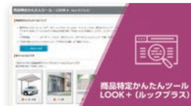
施工後も簡単に特定!商品特定かんたんツール