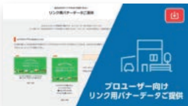
自社WEBサイトやSNS等でご活用いただけるLIXILのWEBコンテンツのリンク用バナーをご提供!