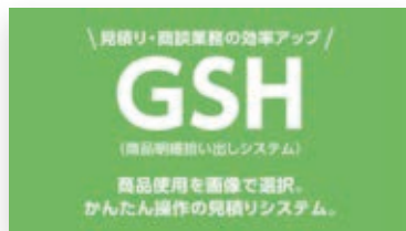
仕様を確認しながら拾い出し、お客さまと完成イメージの共有が可能です