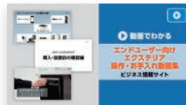
動画でわかる エクステリア操作・お手入れ動画集